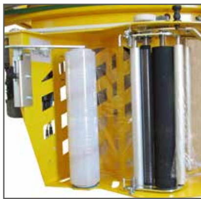
1. Bakre vy på "S-carriage" filmvagn.