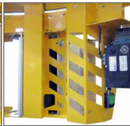
2. Främre vy på "S-carriage" filmvagn.